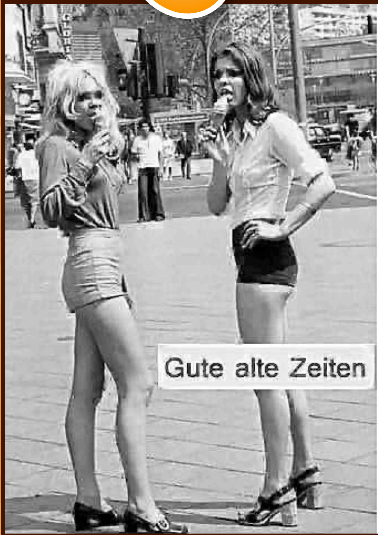
Gute alte Zeiten